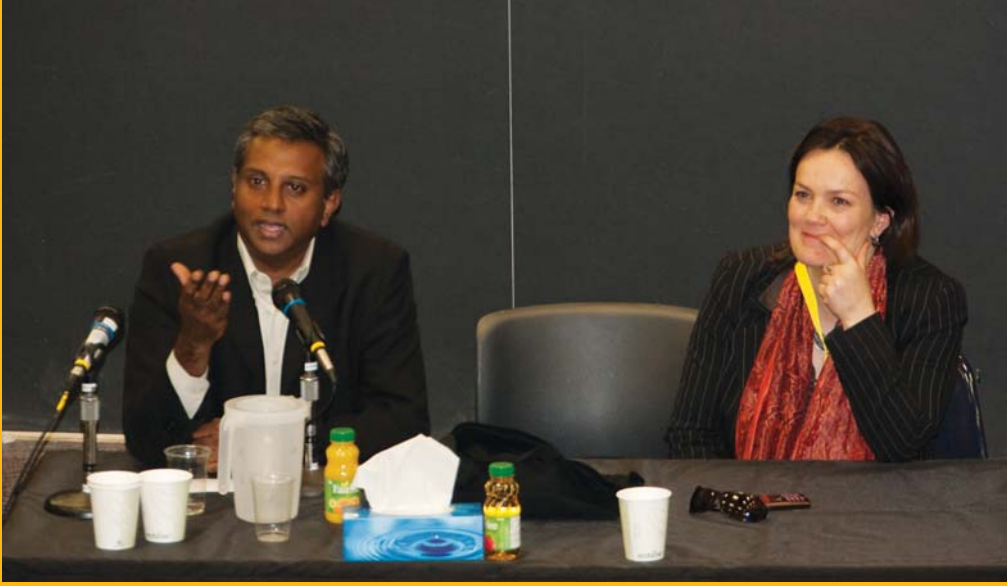
Salil Shetty Uluslararası Af Örgütü Kanada (francophone), şubesinin 2010 yılı yıllık genel Kurulunda şube direktörü Beatrise Vaugrante ile birlikte

S Yoksulluğun üstesinden gelme çabalarınız en az otuz yıldır çalışmalarınızın odak noktası, sizce Uluslararası Af Örgütü'nün insan hakları görüşü yoksulluk karşıtı kampanyalara ne gibi bir katkı sağlar?