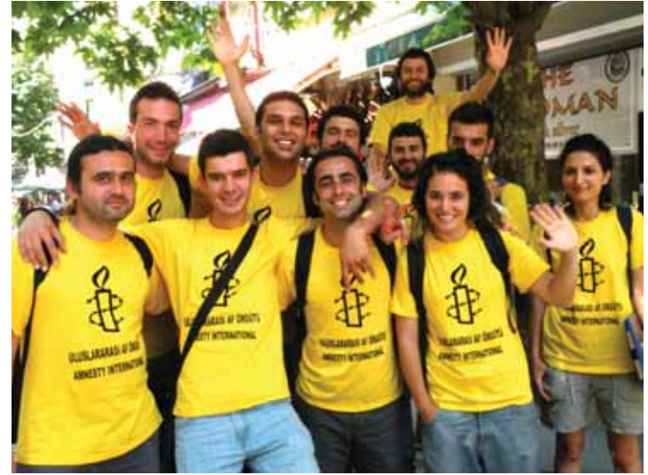
İstanbul Yüz Yüze ekibi UAÖ, insan hakları mücadelesine destek vermek isteyenlere ulaşmak için Mayıs 2011'de Yüz Yüze projesini İstanbul'da başlattı.

Desteğiniz, Türkiye'deki insan hakları mücadelesinin güçlenebilmesi ve daha etkili olabilmesi için çok önemli, bir kez daha çok teşekkürler!