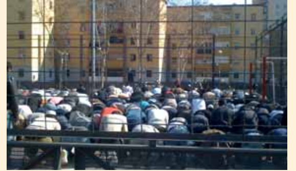
Badalona’nın dışında dua eden Müslümanlar, Katalonya, İspanya, Şubat 2012. Varolan ibadet odaları çok ufak olduğundan Müslümanlar genelde dışarıda ibadet ediyorlar.

Raporda Türkiye ile ilgili sürecin ve durumun da anlatıldığı bölümde şu cümlelere yer veriliyor: “Yüksek öğretimde başörtüsü ve diğer dini ve kültürel semboller ile kıyafetlere yönelik genel yasaklar getiren politika ve mevzuatları koruyarak Türkiye, dinini ve kültürel inancını özgürce ifade etmeyi tercih edenlerin din veya inanç özgürlüğü ile ifade özgürlüğü haklarını ihlal ediyor. Yetişkin